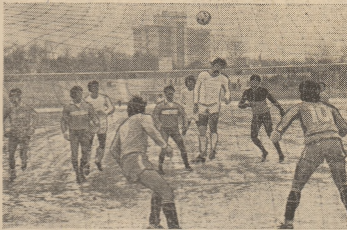
O nouă mare ratare a echipei Rapid. Fundașul Pirvu, venit în atac, reia balonul peste poarta părăsită de Cristian. (Fază din meciul Rapid — F.C. Argeș 0—2).

cea de simbăta trecută, cînd echipele care au jucat atunci în deplasare n-au reușit să obțină decît TREI PUNCTE, prin trei egalități, cele de la Oradea (F. C. Olt), Petroșani (Dinamo) și Hunedoara (Dunărea—C.S.U.). Etapa a 15-a a fost, deci, una normală, cum sînt