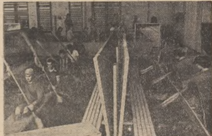
Iarna, la bac, cu gîndul la apele Snagovului, dar mai cu seamă la medaliile marilor competiții ale viitorului