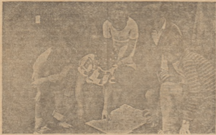
Un grup de „cutezătorii”, în stabilirea unui nou bazei turistice în jurul Cotei 1500 de la Sinaia.

Albele cu imaginile realizate, cu însemnările de tot felul culese din neuitatele drumetii (toate aflate acum, într-o splendidă expoziție, la Muzeul de istorie al R.S.R.) au fost înmînate unei comisi alcătuite din eminenți profesori, specialiști. Aceștia le-au studiat cu amănuntul, reținînd, fiecare în domeniul său, elementele faunistice, istorice, geografice etc. La sfîrșit, C.N.O.P. și revista „Cutezătorii” - organizatorii acestor frumoase și folositoare expediții turistice pionieresti - au invitat, pentru premiere, cele mai bune echipaje din țară. Astfel, marea trofeu „Busola de aur” a fost decernat