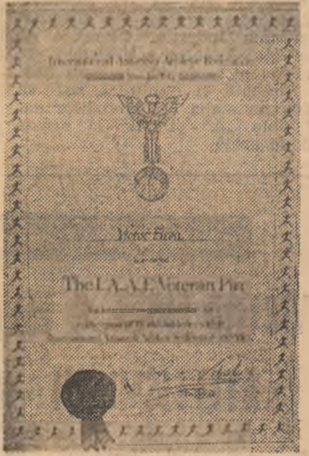
Diploma de onoare a IAAF pentru „merite deosebite aduse la dezvoltarea atletismului pe plan mondial”.

În concursul echipelor masculine primele două locuri au fost ocupate de STIROM C.S.S. 1 Buc. (Romulus Revis, Florin Merdoiou,