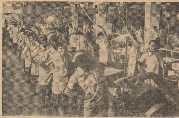
Ca și la „Flacăra roșie“, în numeroase alte întreprinderi din țară gimnastica la locul de muncă este prezentă. Iată o dovadă de la Întreprinderea de confecții din Tulcea.