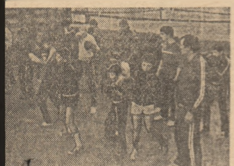
Antrenorilor, în sala de la Dinamo, tinerii tăntă fiecare minut.