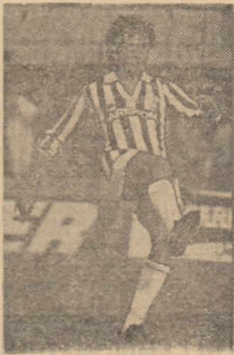
Francezul Michel Platini, cel mai bun fotbalist european în 1983, își confirmă valoarea și în acest an

La Paris, tot în joc amical, Franța a întrecut cu 2—0 reprezentativa Angliei, miercuri seara, pe „Parc des Princes“. În fața a 48 000 de spectatori, Victoria Franței este meritată, grație jocului din repriza se-