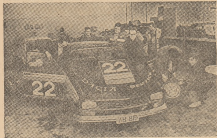
Satisfacție. „22” este gata de concurs, prin munca studenților.

În acest an „Poli” București va fi din nou prezentă la start. Cu patru din cei 9-10 piloți