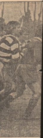
În meciul etapa trecut