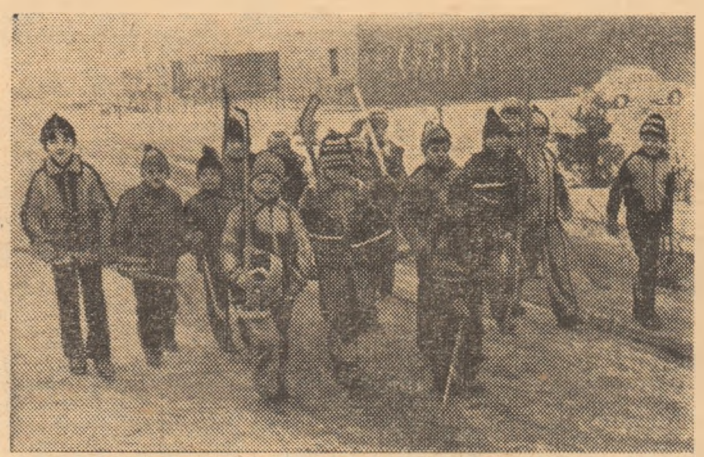
Printre cele mai populare discipline sportive la Miercurea Ciuc se numără, fără îndoială, hocheiul. În imagine o echipă de... pitici venind de la antrenament.