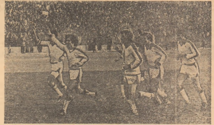
Victorioși, jucătorii de la Dinamo București fac turul de onoare al stadionului „23 August”