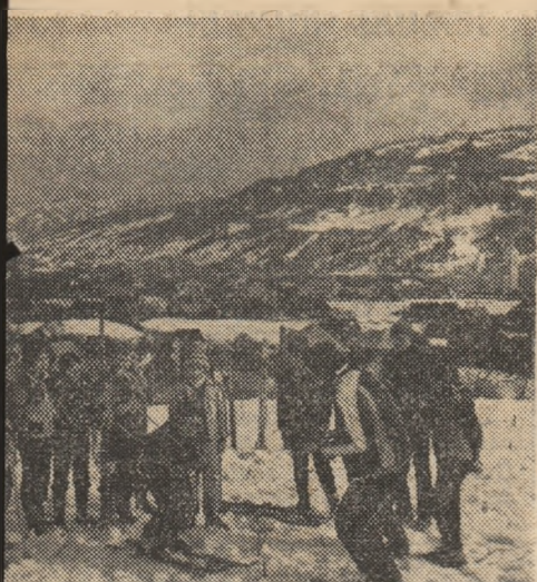
din comuna Telciu, județul Bistrița-Năsăud, unul din cei care au primit premii la concursurile județene de fotografie — aspect de la antrenamentul pe dealurile comunei Telciu