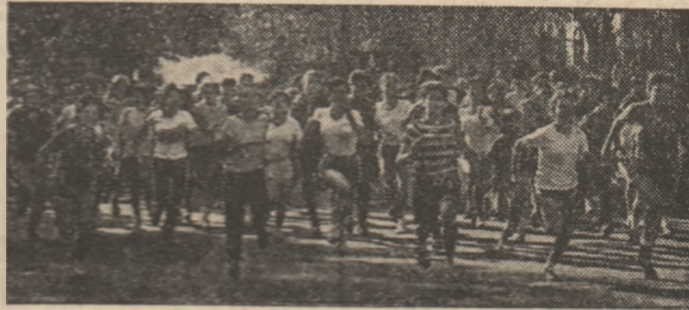
De fiecare dată, sute de tineri și tinere la startul crosurilor de masă din cadrul „Daciadei”

Analizînd desfășurarea întrecerilor de iarnă (noiembrie 1983 - martie 1984), Comisia centrală de organizare a „Daciadei” a stabilit, ieri, ca începînd de la 1 aprilie, în raport de condițiile existente din fiecare județ, să aibă loc înaugurarea oficială a etapei de vară a marilor competiții sportive naționale, aflată la cea de a IV-a ediție. S-au desprins, cu acest prilej, concluzii care dovedesc că, mai ales în ultima perioadă, Consiliul Național pentru Educație Fizică și Sport și organizațiile centrale cu atribuții