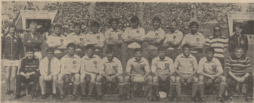
Echipa de rugby a României, fotografiată ieri după amiază, înaintea performanței de răsunet realizată asupra celebrei reprezentative a Scoției!