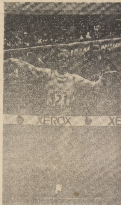
Maricica Puică — victorie la campionatul mondial de cros!

Sigur, simpla inventariere a resurselor existente (în realitate mult mai mari decât cele infățișate pentru exemplificare) nu înseamnă și obținerea sigură a unor noi medalii. Fructificarea lor este condiționată fie de „punerea pe picioare“ a celor accidentați și aducerea lor într-un timp relativ scurt la nivelul formei maxime — deci de o activitate comună, asiduă, a medicilor și antrenorilor, fie de reconsiderarea modului de a privi pregătirea și evoluția în competiții. Ceea ce nu este nici simplu, nici ușor. Le sugerăm tehnicienilor noștri ca, înainte de a privi alte „școli“ s-o cerceteze cu atenție pe a noastră. Vor „descoperi“ discipline — gimnastică, caiac-canoe, handbal ș.a. — unde se lucrează la cei mai înalți parametri, uneori cu pași serioși înaintea altor mari școli. Vor putea afla „tainele“ conlucrării cu oamenii de știință sau necesitatea măririi volumului pregătirii, a creșterii intensității și calității procesului instructiv-educativ. Nu de alta, dar este nefiresc să vină tehnicienii din diferite continente să învete de la români, iar ai noștri să aștepte alurea „cheia de boltă“.