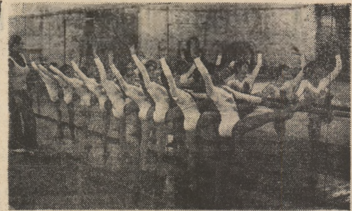
Activitate susținută în sala de gimnastică de la C.S. Petrolul, sub conducerea antrenorei coordonatoare Leana Sima