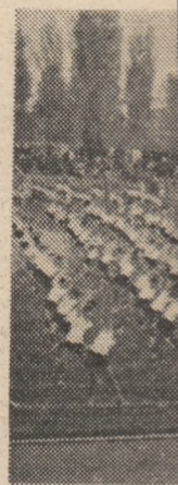
Copiii, performanți la competiții municipale

mentul general, această adevărată sportivitate românească sînt puterice și pe melea