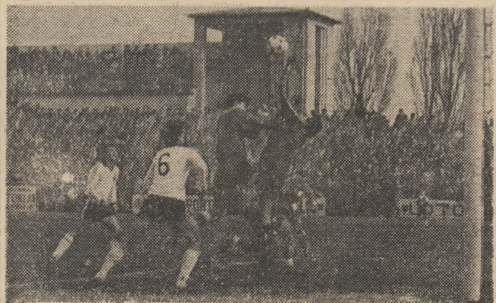
Fotbalul a adus Aradului 6 titluri de campion național