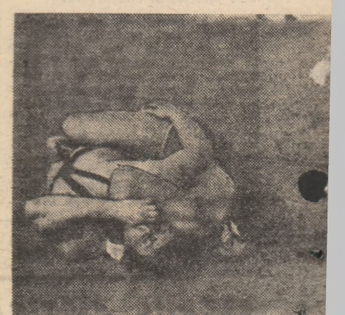
Semigreeul Ion Baciu (Steaua) l-a învins Csaba Abram (Mureșul Tg. Mureș).

semigreeul Ion Baciu (Steaua) l-a învins Csaba Abram (Mureșul Tg. Mureș).