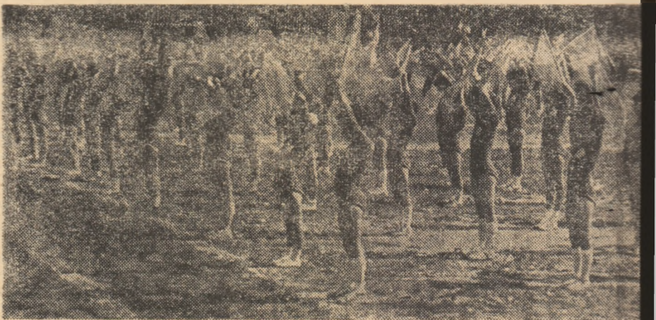
Secvență dintr-o splendidă repriză — cea de gimnastică cu stegulețe — a Festivalului copiilor din sectorul 6 al Capitalei...

să fie prezent al inspectoratelor detene și al C. tene ale organizațiilor, insti domeniul sport copii.