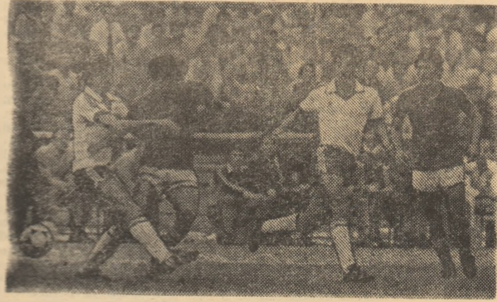
Manea, „pasărea rară” din inaintarea Rapidului, oprit în meciul cu Dinamo să-și ia zborul...

2. O departajare în clasament de trio-ul amenințelor cu retrogradarea (Dunărea C.S.U.