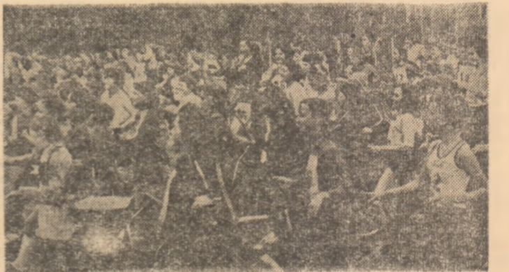
La „Chemarea toamnei”, ca frunza și ca iarba...

tenta, îndeminarea) la nivelul notelor 8, 9 și 10, peste 180 000 de participanți la marea competiție națională „Daciada”, 145 000 de posesori ai brevetului complexului „Sport și Sănătate”, 40 000 de „amici ai drumetiei” recordul... mondial de participare la orientare turistică — 39 000 (în 1981, în „Chemarea toamnei”). Și nu este de mirare că sibiienii, în ultimul clasament național al „Daciadei”, au ocupat locul 3 pe țară la activitatea sportivă