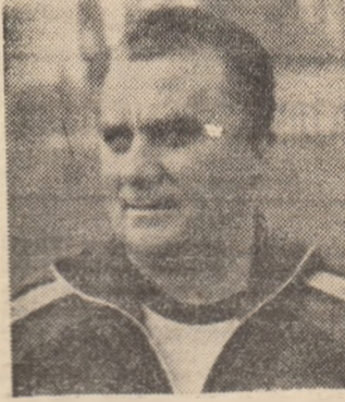
un înaintaș cu gabaritul lui Că- mătaru...