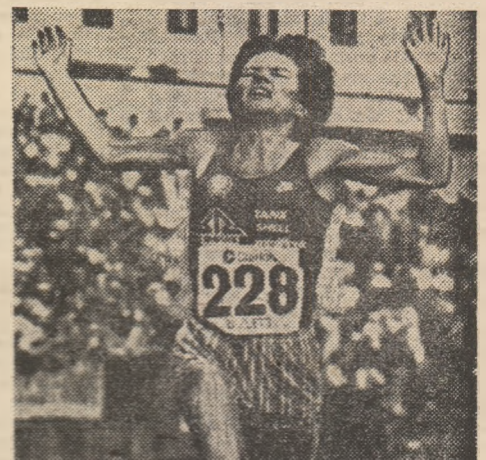
Norvegianca Ingrid Kristiansen a stabilit recent, la Oslo, un valoros record mondial pe 5 000 m: 14:58,89, fiind prima atletă care coboară sub 15 minute