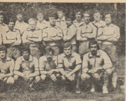
GLORIA Bucuresti, echipă recent promovată în Divizia „A”