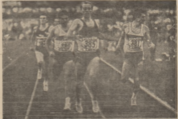
Steve Ovett, recordman mondial la 1500 m și campion olimpic la 800 m, conduce la concursul atletic de la Lausanne. (probe de 800 m), al cărui final este înfățișat în imagine.

TOKIO. Tradiționalul concurs al celor 8 națiuni se va desfășura