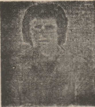
urce chiar în lotul reprezentativ"