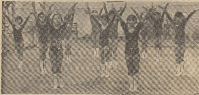
În sălile de pregătire ale Liceului de gimnastică, activitate intensă de desăvârșire a măiestriei