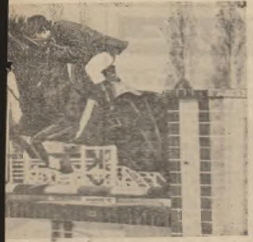
...anin special de iubirii călăriei din Sibiu