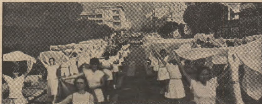
Sport, mișcare, grație, armonie — într-o frumoasă demonstrație la Deva

tenție corespunzătoare și activității sportive — am în vedere activitatea sportivă de masă, nu numai aceea de club — participării active a tineretului, a tuturor oamenilor muncii la această activitate care constituie o parte inseparabilă a muncii de formare a omului nou, sănătos, cu o concepție înaintată, care să se bucure din plin de toate cuceririle civilizației socialiste și comuniste. Trebuie, deci, să împletim activitatea de pro-