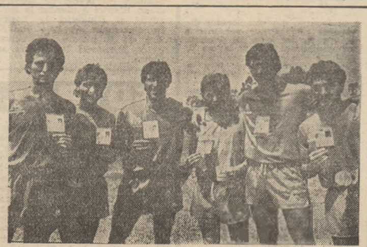
Dupa ce au devenit campioni mondiali în Spania, fotbalistii italieni — în imagine, șase dintre ei — sferă să devină campioni olimpici la Los Angeles.