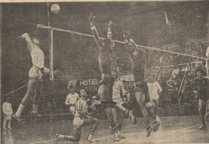
Dinamo și Steaua au oferit în ultimii 20 de ani o pasionantă concurență, stimulatoare pentru voleiul nostru masculin...

Treptat, însă, voleiul românesc a cunoscut o și mai puternică ascensiune pe scara valorilor internaționale, o dată cu creșterea continuă a condițiilor materiale de practicare a lui de către toți cei care îl in-