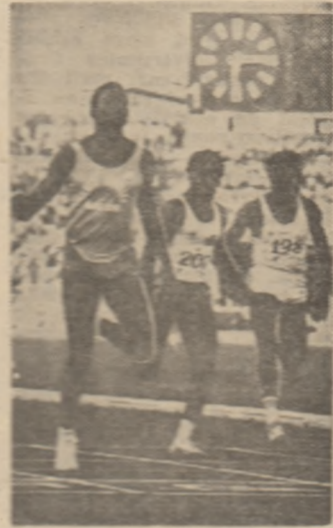
Carl Lewis câștigă cursa de 100 m la concursul internațional de la Budapesta.

Concursul desfășurat luni seara, pe Nepsstadion, „Marele premiu internațional” al Budapestei, a reunit câteva somități ale atletismului internațional. Dintre toți, vedetele reuniunii au fost sovieticii Aleksandr Krupski, Iuri Sedih și americanul Carl Lewis. După ce a trecut din a treia încercare, 5.82 m la prăjină, Krupski a încercat să doboare recordul mondial punind stacheta la 5.91 m. Campionul european Iuri Sedih, recordman mondial la ciocan, a aruncat din nou peste 85 m (85.020 m), între-