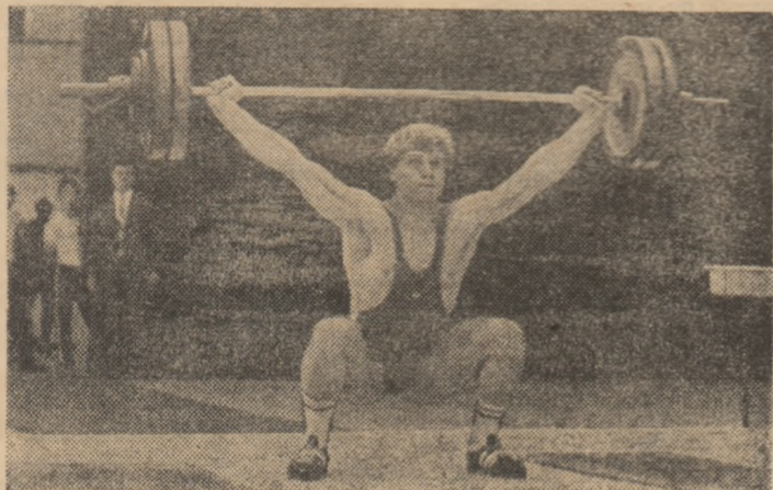
Campionul olimpic Nicu Vlad cîștigă fără dificultate întrecerea la categ. 90 kg

din vremea cînd ferestrele vi-brau de încurajările și aplauzele adresate voleibaliștilor feroviari. De astă dată, cei care au declanșat entuziasmul au fost halterofilii (peste o sută, din 20 de cluburi și asociații sportive din Capitală și din țară), care s-au întrecut în cadrul „Cupei a 40-a aniversare”. Dirigența cu care și-au apărât șansele a scos în evidență, în primul rînd, faptul că acești sportivi, indiferent dacă sînt sau nu consacrați, dacă mai au încă de ridicat sute și sute de tone pînă să li se recunoască valoarea... la cîntar, nu sînt ispițiți să se culce pe laurii proprii sau ai altora, ci își vîd, în continuare, de treabă, adică se antrenează non-stop. În sală