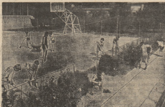
Un aspect de muncă patriotică la pregătirea bazelor „Voinicelul”

Selecionata de hochei a țării noastre a plecat la Riga pentru a lua parte la una din grupele tradiționalei competiții dotată cu „Cupa Sovietiki Sport”. În această grupă au fost repartizate formațiile Sokol Kiev, Dinamo Riga, Dukla Jihlava, Ijstal Ijevsk și TSKA Moscova, pe care hocheiștii români le vor întâlni în această ordine. Primul meci are loc mîine, duminică, 9 septembrie, iar ultimul în ziua de 15 septembrie. Cîștigătoare va evolua în finală, la Moscova.