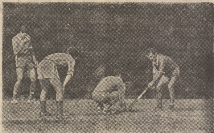
Meciul de sîmbătă, de la Sebes-Alba, dintre Dinamo și C.P.B. a fost, în bună măsură, o reeditare a celui de anul trecut, de la București (din care redăm imaginea alăturată), dinamovistii fiind din nou superiori tipografilor la „bătăia mingii”