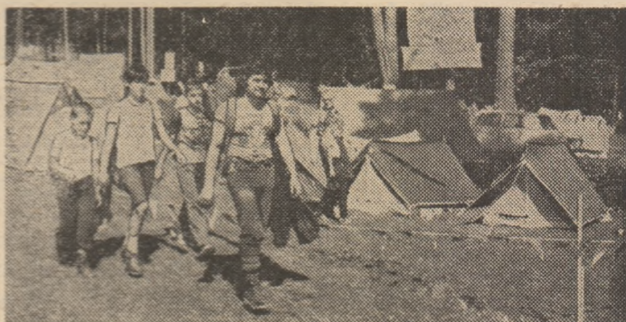
Frumusețea și binefacerile drumețiilor și excursiilor fac să sporească, an de an, în întreaga țară, numărul celor care îndrăgesc această activitate sportivă de masă