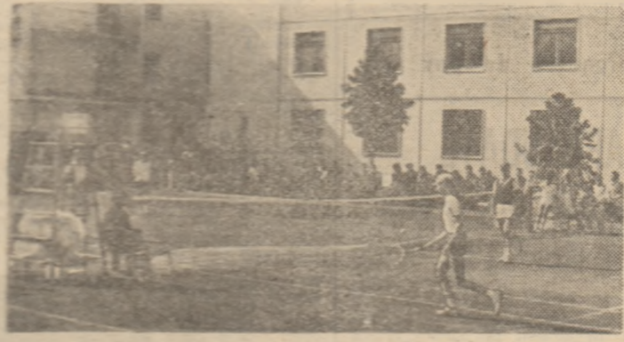
Unul din cele șase terenuri de la Tenis club școlar „Chimistul” din Ploiești.

care copiii intră pe terenurile de tenis, se regăsește în felicitările pe care „sportul alb” le-a primit la „Cupa Voința” la tenis, le-au adresat organizatorilor pentru calitatea celor șase terenuri și, în general, a condițiilor create pentru această primă competiție internațională. Dintr-o echipă de tineri, Kado Zamoreanu și Ilie Nicolae, și-au și întorsit