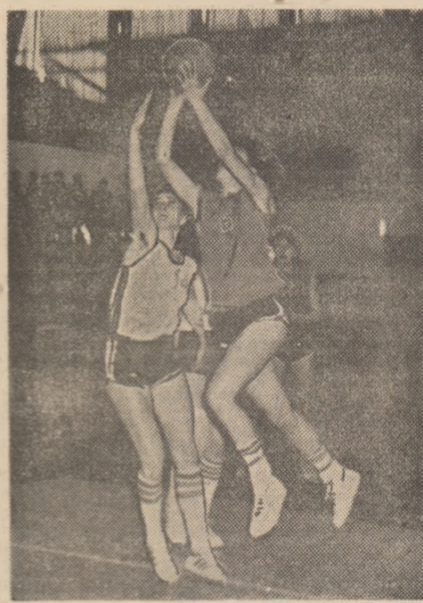
Baschetul feminin oferă deseori faze dinamice, așa cum ilustrează imaginea de mai sus pe care o dorim repetată cît mai des în întrecerile Diviziei „A“.