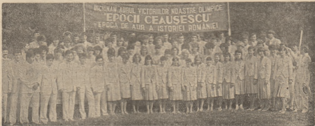
DECIȘIUNEA AURULUI VICTORIILOR NOASTRE OLIMPICE EPOCII CEAUȘESCU EPOCA DE AUR A ISTORIEI ROMÂNIEI

...un tineret care trăiește într-o țară socialistă poate să aspire la cele mai înalte succese în sport, ca și în toate domeniile de activitate”.