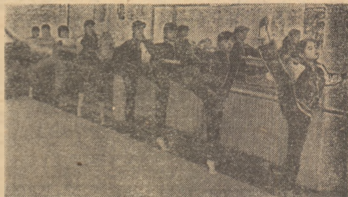
O parte dintre gimnastele „titulare” ale grupei de performanță pregătite de prof. Mihai Demetrescu (C.S.Ș. 2 București)

țatul celor 37 de fete prezente în sală, care mai de care mai atentă la execuția la aparatul la care lucrea, s-au detașat, freso