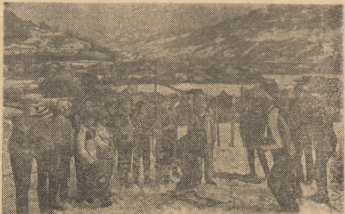
„Daciada” la primii pași. O secvență-invitație pentru toți (mari și mici) la munte. În curînd vine zăpada...

de la prima sa ediție, de o largă și entuziastă adeviere. O competiție care avea să răspundă unel cerințe reale, concrete și majore, așa cum de altfel se și precizează în Mesajul pe care secretarul general al partidului l-a adresat mișcării noastre sportive în 1982: „Să facem în așa fel încît marea competiție sportivă națională „Daciada” să cuprindă practic, în cadrul ei, întregul tineret al patriei, să se afirme tot mai puternic ca o uriasă mișcare de masă care să asigure participarea celor mai largi categorii de oameni ai muncii de la orase și sate la practicarea organizată și sistematică a exercițiilor fizice.