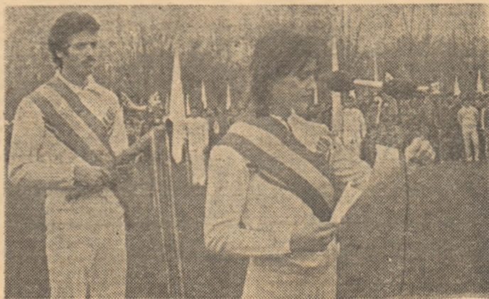
Aspect de la festivitatea prilejuită de sosirea „STAFETEI PĂCII”, pe Stadionul tineretului din Capitală, în aprilie 1982. În primul plan fotografiați, doi mari sportivi români, Corneliu Ion și Nadia Comăneș, care citește APELUL DE PACE adresat sportivilor din întreaga lume de către sportivii români

promovată cu consecvență de România, de președintele ei, tovarășul NICOLAE CEAUȘESCU. În spiritul politicii externe a partidului și statului nostru,