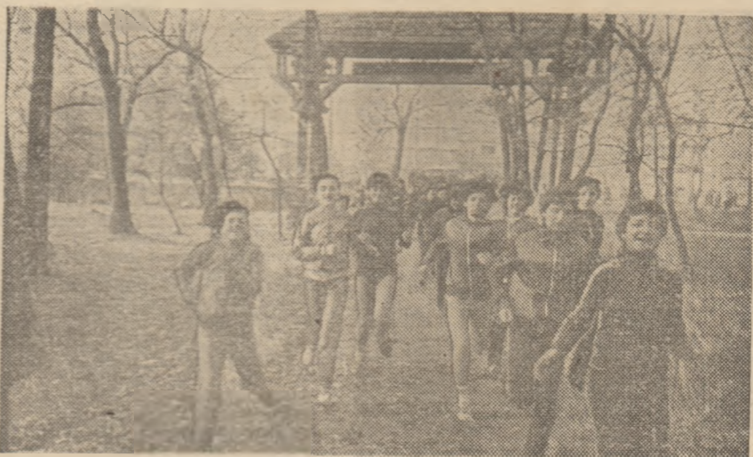
Pe traseul crosului din Padurina Crihala, concurențele au trecut pe sub o poartă ce ne duce cu gândul la frumoasele porți maramureșene, dar și la cele, la fel de vestite, din Hobița lui Brâncuși

rilor, cînd pe străzi s-au revărsat suvoaie de tineri care se îndreptau spre bazele sportive ale orașului pentru a participa la întrecerile sportive organizate în cinstea Congresului al XIII-lea al partidului. Era o revărsare de tinerete pe străzile bătrînului oras întine-