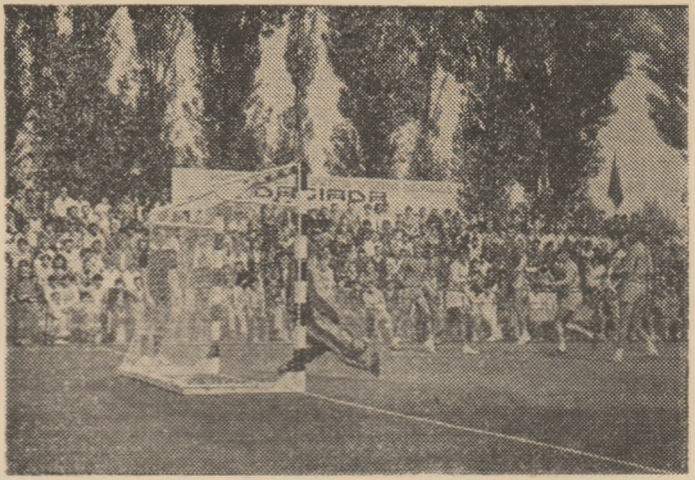
Cu doar cîteva luni în urmă un loc viran, acum pe acest teren a fost amenajat un modern complex de handbal al întreprinderii de mașini-unelte din Bacău