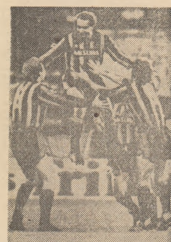
K.H. Rummenigge (în centrul imaginii) autorul unui gol în meciul cu Napoli, în care Inter a câștigat cu 2-1.

● În al doilea meci amical, desfășurat la Miami: S.U.A. — Ecuador 2-2 (2-1).