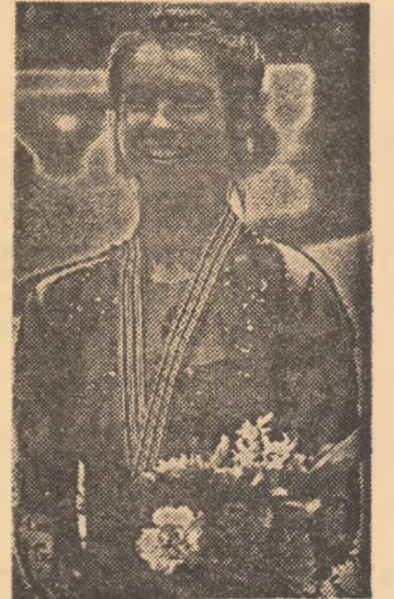
Katarina Witt, cea mai bună patinatoare artistică din acest an, la care a câștigat autoritățile toate competițiile la care a participat

(47,75 s), probă la care rezultatele sale au evoluat astfel: 1975 - 52,0 (yarzi), 1976 47,63 (record mondial), 1977 - 47,45 (rec. mondial), 1978 - 47,94, 1979 - 47,53, 1980 - 47,13 (rec. mondial), 1981 - 47,14, 1982 - nu a concurat, 1983 - 47,02 (rec. mondial), 1984 - 47,58.