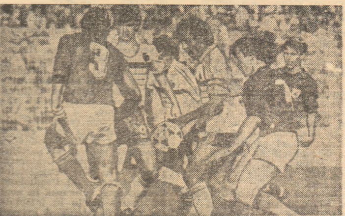
O fază din meciul Luxemburg — Franța (0-4) din preliminariile C.M. În centrul imaginii (în tricou alb) Stopyra și Platini

În aceste 12 partide, francezii au înscris 27 de goluri și nu au primit decît 4! Un golaveraj excelent! Printre golgeterii repre-