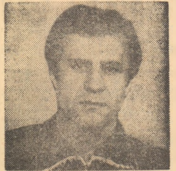
Deținător al recordului de prezențe în campionat (dintre jucătorii în activitate), „veteranul” Ispir obține și un alt record: cel al remarcărilor în turul actualului campionat (15)

Parcursul acestei liste, destul de lungă, de altfel, invită la câteva reflecții. Să încercăm să le punctăm.