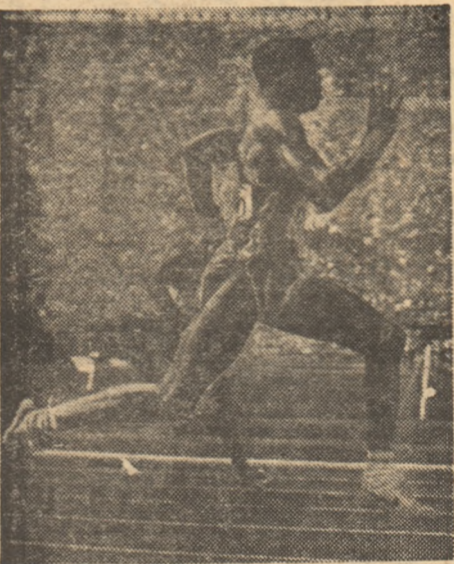
Carl Lewis, cvadruplu campion olimpic

Li Ning - 6 medalii la J.O. de la Los Angeles meri, ale marilor performanțe, la fel a fost și lista marilor surprize. Este cazul victoriilor olimpice reputele la Sarajevo de italianca Paoletta Magoni la slalomul special și de elvețianca Michela Figini la coborâre, ca și al... contraperformanță hocheiștilor americani (cu patru ani înainte, la Lake Placid, campioni olimpici) clasăți acum abia pe locul opt (ultimul!). Multe surprize, de toate felurile, au fost și cele de la Olimpiada de vară. Una dintre ele, de mari proporții, a fost cea înregistrată în proba de 200 m flutură, în care marele favorit, vest-germanul Michael Gross , campion mondial și recordmanul lumii, a fost întrecut de un tânăr de 17 ani, australianul Jon Sieben (1:57,04 față de 1:57,40), pînă la ora J.O. un înător oarecare, practic necunoscut în marile bazine. Surprinzătoare este, desigur, și comportarea Ulrikel Meyfarth , la săritura în înălțime, campioană olimpică, la 16 ani, în 1972 cu 1,92 m și în... 1984, cu 2,02 m!