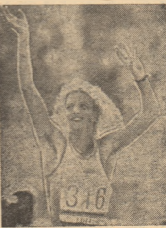
Încheind cursa de 3000 m, pe care a dominat-o tactic, cu un nou record olimpic, marea noastră atletă Maricica Puică salută bucuroasă pe cei 100.000 de spectatori de pe Memorial Coliseum, în urma unei memorabile victorii.

Este greu, foarte greu să alcătuești o ierarhie (subiectivă) a marilor momente care au avut drept erol ai întrecerilor olimpice pe sportivii români. După cum nu este ușor să acorzi prioritate unei discipline sportive sau alteia într-un clasament al con-