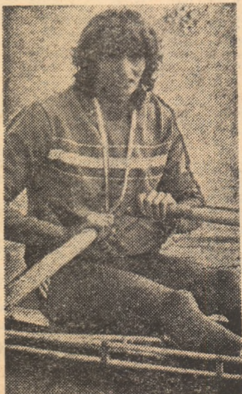
Valeria Răcilă, învingătoarea olimpică în proba de simplu, denumită „regina canotajului”