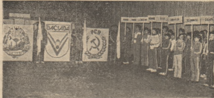
Aspect de la festivitatea de deschidere a primei finale, cea de tir, din cadrul „Daciadei” de performanță, din anul 1985

de la 10 m. La acest eveniment au participat peste 250 de tînăși — reprezentînd 23 de secții din 13 județe ale țării — cei mai buni, desemnați în etapele anterioare ale întrecerilor, pe asociații sportive, cluburi și localități, județene și interjudețene. Prezența celor mai buni tînăși în probele de tir cu arme cu aer comprimat constituie o primă garanție că întrecerile care încep astăzi, de la ora 8,30 (în program: pușcă 60 diabolouri seniori și juniori, pușcă 40 d. junioare și pistol