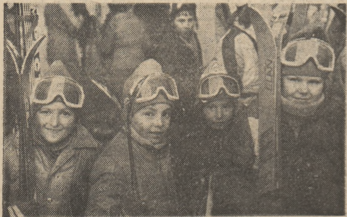
Prin concursurile „Dacia”, primii pași ai copiilor spre schiul de performanță...

pic 1985—1988, oferind specialiștilor informații concrete asupra nivelului calitativ atins de cei mai buni performeri români în aceste sporturi. Pentru că la finale vor fi într-adevăr acei sportivi care s-au dovedit a