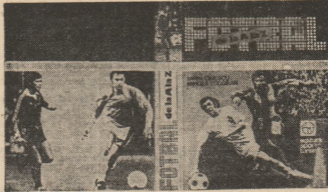
FOTBAL DE LA A LA Z