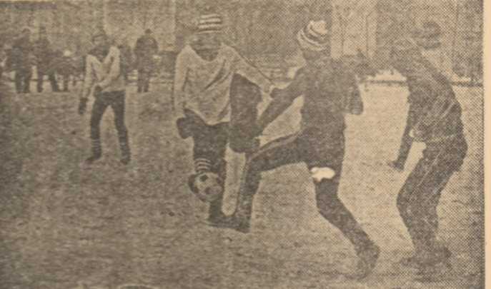
Fotbalistii din fotografie (Berceni, subcentrul Sportului studențesc) stît doar copii, dar și jocul la această vîrstă cere legi precise...

* „Fotbal — aspecte actuale ale pregătirii juniorilor” de Mircea Rădulescu și Eugen Cristea (Ed. Sport-Turism)