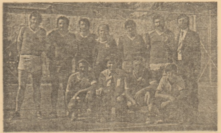
Echipa de volei a asociației „Energo“ Bacău, cîștigătoare a multor ediții republicane a competiției pe ramură „Cupa energeticianului“ din cadrul „Daciadei“