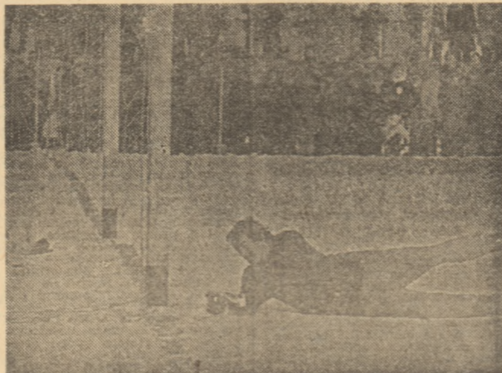
Apa s-a decis calitatea la București: Irinescu a tras primul sut pe poartă. Polgar nu l-a putut opri și... Universitatea Craiova merge mai departe.

(C) în pag. 2-3 cronicile celor opt jocuri.