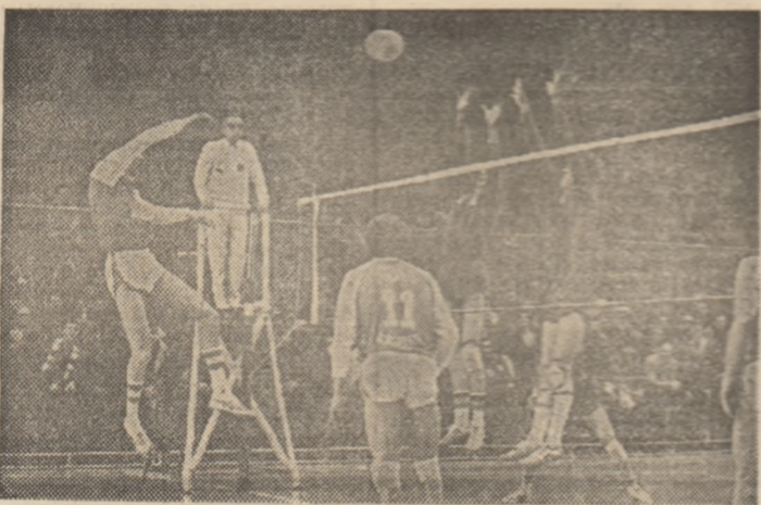
Trage puternic Pop. Sar la blocaj Dascălu și Șoica (așa din meciul Dinamo — Steaua, desfășurat în Capitală)