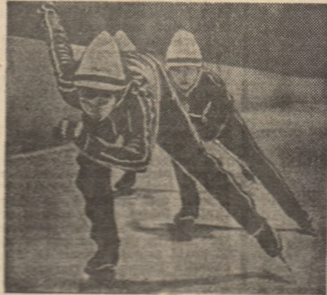
Tinerii participanți la Sporthochschule, întrecându-se într-o cursă de patinaj viteză.