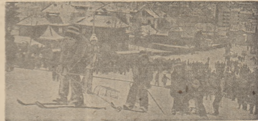
Aspect cotidian al acestei țerni pe pirtia de schi din Vatra Dornei

În prima zi a finalelor „Daciadei” la schi fond-seniori