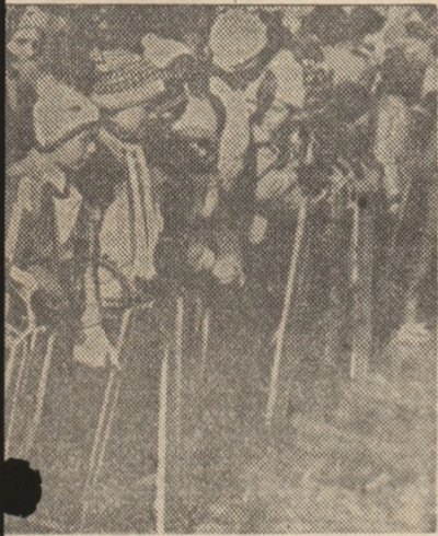
Meri — gata de start

ULUI DEMOCRAȚIEI ȘI UNITĂȚII SOCIALISTE)