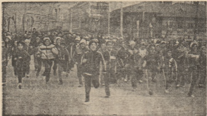
Parcul Tinerețului din Capitală este mereu o gazdă primitoare a intrecerilor de cros pentru toate categoriile de vîrstă.

● SATU MARE. În localitate a avut loc o reușită competiție de scrimă, la toate probele, la care au luat parte