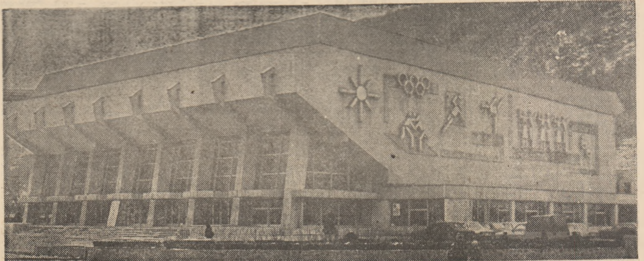
Sala sporturilor se încadrează armonios în noul peisaj al municipiului Reșița