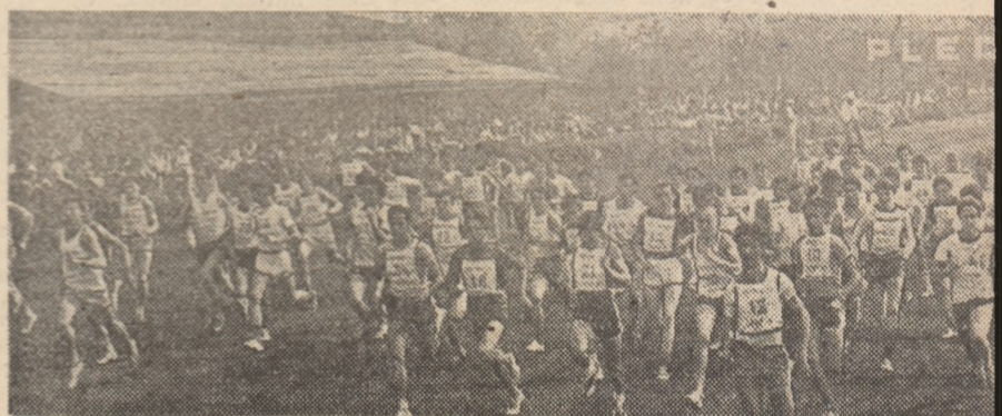
Crosul, mijloc îndrăgit de practicare a sportului, de întărire a sănătății

fenomenul sportiv și oane și săli de bazine și parcuri. Desprindem program de concursuri de concursuri.