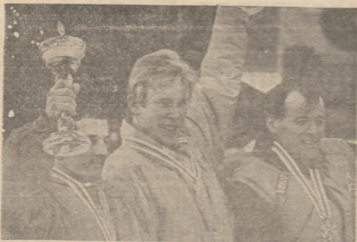
Succesul Gunde Svan (în mijloc) este câștigătorul concursului din acest an a „Cupei mondiale“ la schi fond, cu 152 p. Pe locurile următoare: Tor-Hakon Holte (Norvegia) cu 117 p., Ove Aunli (Norvegia) și Thomas Wassberg (Suedia) cu 114 p.