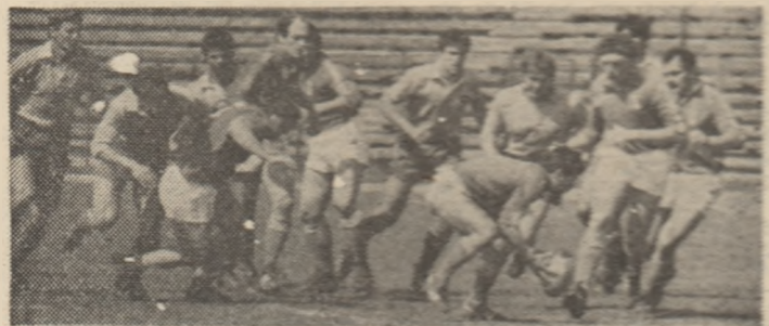
Una din fazele „fierbinți” ale meciului de la Brusor.

CLASAMENTUL după acest joc: 1. Franța 12 p. (din 4 meciuri), 2. Italia 8 p. (din 4 meciuri), 3. România 7 p. (din 3 meciuri), 4. Spania 5 p. (din 3 meciuri), 5. Tunisia 3 p. (din 3 meciuri), 6. U.R.S.S. 1 p. (din 3 meciuri).