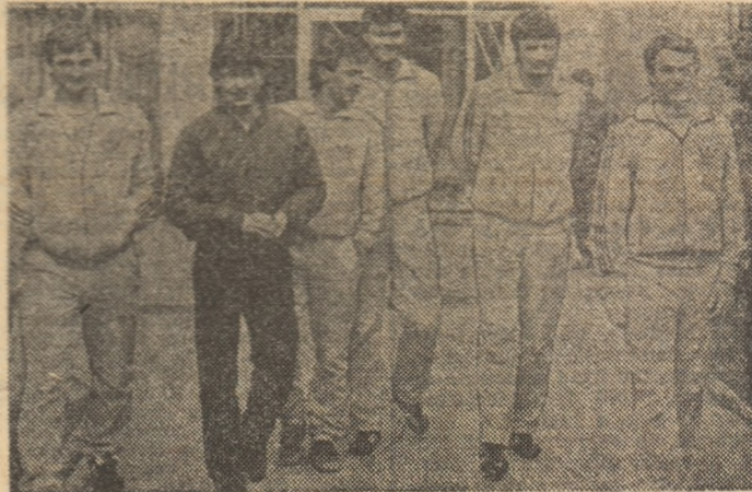
Tricolorii au început pregătirile pentru meciul cu Anglia cu zimbetul pe fețe

jocului care se va disputa la București, în ziua de 1 mai.