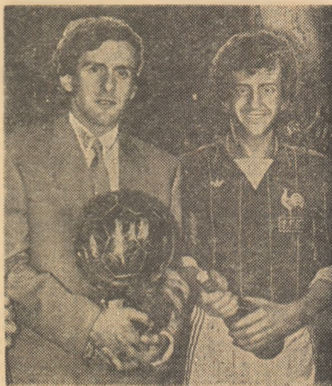
Michel Platini și... copia sa, în ceară, de la Muzeul Gravin din Paris.

SPANIA (meciuri tur, din etapa a 2-a a „Cupei”): Gijón — Sevilla 1-1, C.F. Barcelona — Real Sociedad 2-0, Athletic Bilbao — Malaga 3-2, Castellon — Espanol 1-3, Valladolid — Zaragoza 2-3, Atletico Madrid —