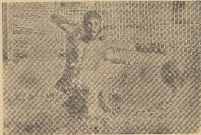
Orădeanul Raț îl învinge pentru a doua oară pe Simlon. (Fază din meciul Crisul - Rapid)

hibiție, irosindu-se situații de superioritate la ambele porți. Au fost, în minutul de debut al întîlnirii, două bare - de o parte și de alta -, după care orădeanul Gordan a deschis scorul (min. 2,20), a egalat, din 4 m. Gaiță (min. 2,35), iar Gh. Ilie a adus Rapidul în avantaj (min. 4,18). Avea să fie unica situație de acest fel: după "bolta" lui Raț din min. 4,53 (2-2), Crisul a preluat conducerea în min. 8,54 prin același Raț și a deținut-o permanent. La două și chiar trei goluri diferență, cu excepția minutelor 11 și 20, cînd feroviarii au strîns rezultatul la un singur punct. Filmul momentelor de concretizare: Fejer - min. 9,51 (4-2), Ilie - min. 10,29 (4-3), Fejer - min. 13,06 (5-3), Garofeanu - min. 14,28 (6-3), Angelescu - min. 14,52 (6-4), Gordan - min. 17,02 (7-4), Arsene - min. 18,10 (7-5), E. Ionescu - min. 19,48 (7-6), Pantea - min. 20,45 (8-6), Garofeanu - min. 23,37