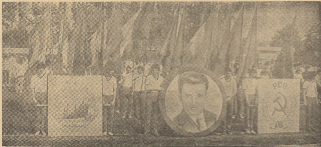
Cei peste 2000 de competitori studenți la festivitatea de deschidere a frumoasei manifestări cultural-sportive de pe „Tei”

O amplă și entuziastă manifestare sportivă și cultural-educativă la complexul studențesc „Tei” din Capitală