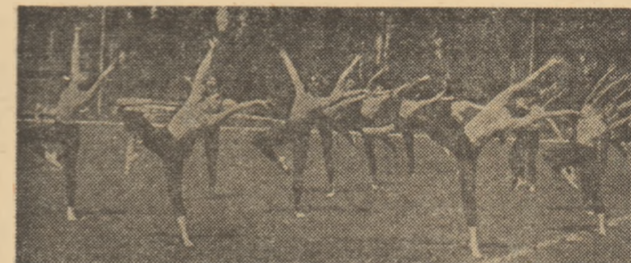
Gimnastica ritmică a cules multe aplauze

De altfel, și în concursurile pe centrul universitar București politehniștii au adus bucurii în rîndul susținătorilor lor, dominînd întrecerile de atletism, handbal, judo, gimnastică sportivă. Iată cițiva dintre învingătorii finalelor: canoe 1 (m) — Universitatea Galați, caiac 1 (f) — Politehnica București, caiac 1 (m) — „Poli“ Timișoara, caiac 4 (m) — „Poli“